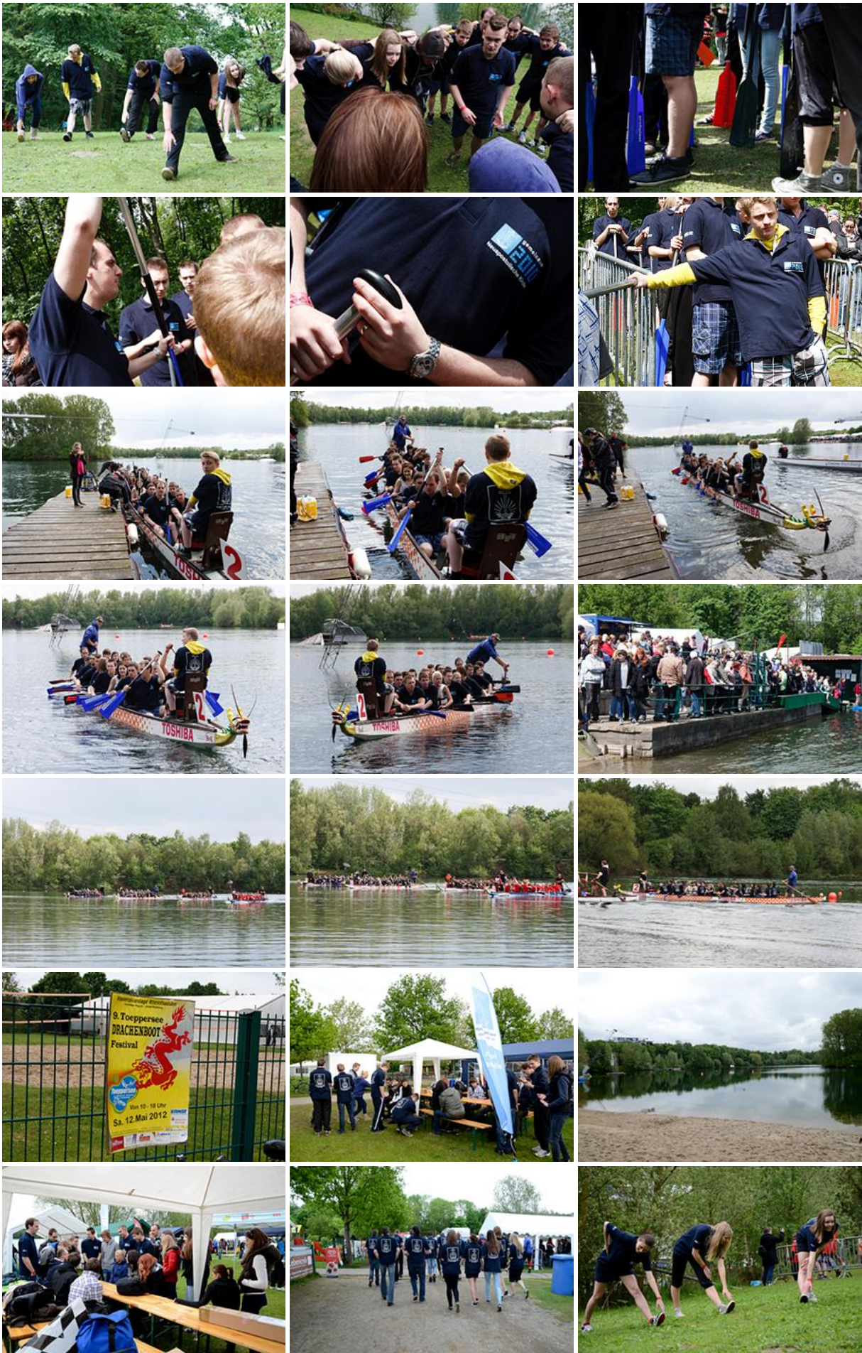
Alle in einem Boot beim Drachenboot-Festival