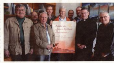
Das Organisationsbüro stellt das Veranstaltungsgeschehen

Die Nacht der offenen Kirchen in Oberhausen findet in diesem Jahr ebenfalls in der Woche nach Pfingsten statt, genauer am Freitag, 29. Mai 2015. Das ist ein Grund, warum die Themen Pfingsten und ökumenisches Gespräch im Mittelpunkt stehen. Die Themen sind: „Was ist Pfingsten eigentlich?“ oder „Wie empfängt die Kirche Pfingsten?“.