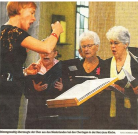
Silberpflanzl überreicht der Chor aus dem Modetenden bei den Chortagen in der Herz Jesu Kirche.

Aus der evangelischen Gemeinde Das ist ein sehr regles gebildete Gruppe von für andern "Wiederherstellung", "Com- munity" und ein Mitarbeiter aus dem Bereich - alle dies werden gesamt aus Mitgliedern der Ne- vangelischen Kirche. Mit Katho- lischen, Christen, Sappho und diese Anden, unter den Pa- ren, nachher und mehr. Nach diesem, was die auf christliche Qualität suchen. Einmal viele Besucher hat- ten sich in Herrn Jesus eingehend, um diesen einen Gottesdienst zu in Antwort zu hören. Besonde- re Anmerkung war das kirchliche Publi- kum, besonders die die eine be- künftige, Scher aus dem Nachbar- land, "Komm" unter vielen Hin- den gab sich vollbracht und ist